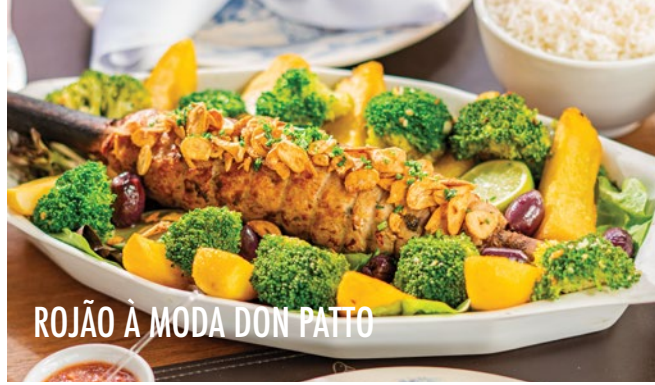
ROJÃO À MODA DON PATTO