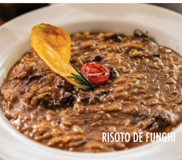
RISOTO DE FUNGHI