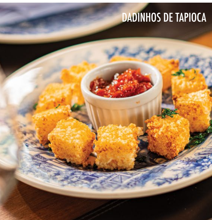
DADINHOS DE TAPIOCA