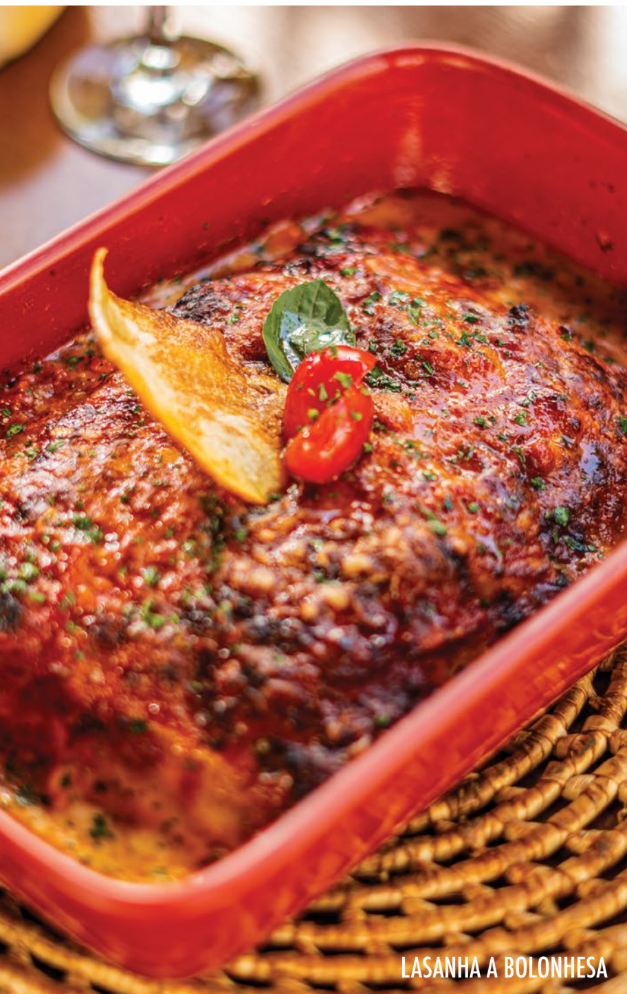
LASANHA A BOLONHESA