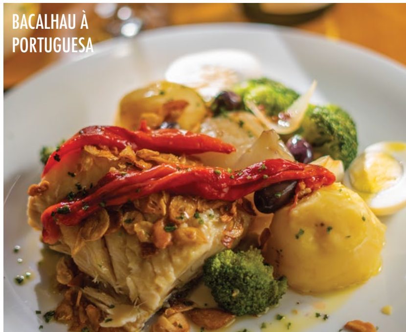
BACALHAU À PORTUGUESA