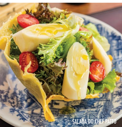
SALADA DO CHEF PATTO

Salada verde com gomos de laranja, croutons, palmito, alcachofra tomate cereja e muçarela de búfala.