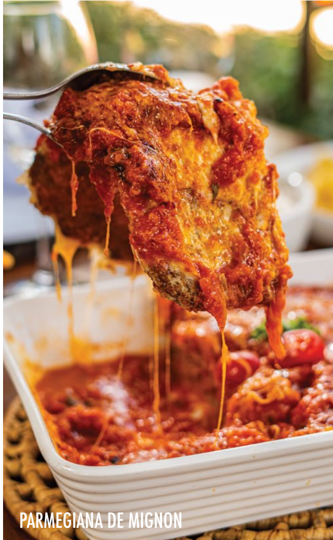
PARMEGIANA DE MIGNON