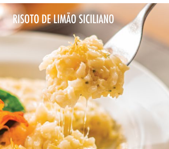
RISOTO DE LIMÃO SICILIANO

Lascas de carne de pato, bacon, linguiça defumada, cebola chips, alho, azeitonas portuguesas e cheiro-verde.