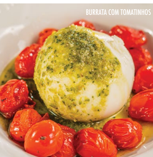
BURRATA COM TOMATINHOS

Linguíça portuguesa a base de carne suína, miolo de pão e especiarias, servida com batatas aperitivo, pimenta biquinho, pão português e ovo frito.